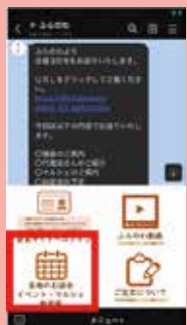
LINEトーク画面の赤枠からカレンダーへ

各地のお話会・マルシェ・ワークショップ等のWebで利用できるイベントカレンダーができました！それぞれカレンダー上のタイトルをクリックしていただくと、日時や内容などが画面にポップアップ！詳細の内容がわかります。