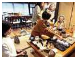
マリムーンに果物やヨーグルトをのせて実験