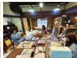
みんなでわいわいミシン作業