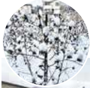
春の雪が積もった綿畑