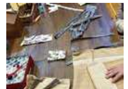
完成を想像しながら楽しい時間

マリムーンショルダーを購入されたあと、「替えのカバーが欲しくなるね」というお話から、2月お話し会の後、手作りマリムーンショルダーのカバーを茶綿クロス4で作りましょうという会をいたしました！