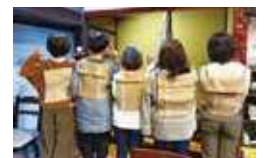
ナイスな仕上がり！

マリムーンに食べ物をのせた実験で味の変化を体験したり、みんなでにぎやかに布良についての意見交換したり楽しいひとときを参加者の方と過ごすことができました。