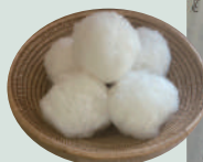
生成綿の コットンボール