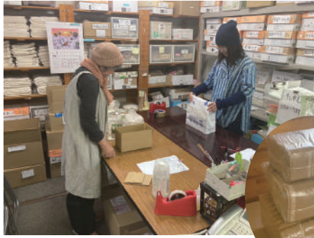
新春キャンペーン発送風景 茶綿クロス1・2・3の山

2024年2月発行 発行／ふらのわ（株式会社布良） 東京都中央区八丁堀 1-11-5 オクヤマビル3階 tel.03-5540-8511 fax.03-5540-8601 定休日：日・月・祝日 メール：hula@cure.ocn.ne.jp web：http://www.fulanowakai.com