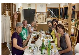
夜の楽しい食事タイム