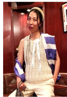
名古屋市長 市メイ

私は名古屋市中区でライブラウンジを経営しています。皆さんに愛され、お店を十五年続けてきましたが、三年程前にコロナ禍が始まり、休業を言い渡されました。余りのショックに途方に暮れ、突然のめまいで天井がぐるぐる回って歩けなくなったり、再開の目処のたたない店を維持する事への不安や苦しみの日々でした。