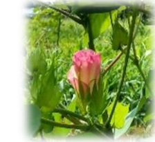
綿の花。これからたくさん花が咲いていきます。楽しみです！