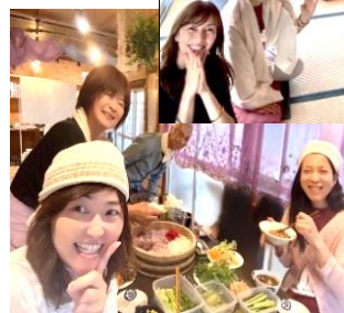
教室の食事 ガの後食

初めての布良との出会いは、五月の種まき祭のイベントでした。購入したクロス4をその日から早速首に巻いてみました。更年期障害からなのか毎日起こっていたホットフラッシュが消えたことに大変驚きました。そしてお話会に参加したとき、