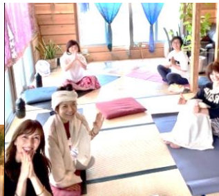
まヨガの教室 を良と教