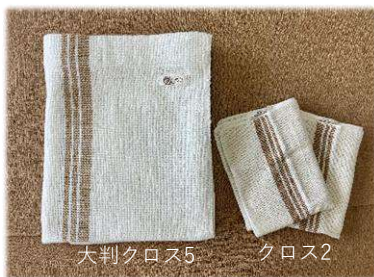
大判クロス5 クロス2

大判クロスは子供さんの寝具として(大人用としてもこれからの季節快適に利用していただけます)又ひざ掛け等々使い方多数です。是非この機会にどうぞ。