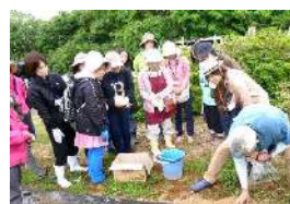
10:30 社長から種の魂の蒔き方を伝授、種まきがスタートしました！