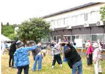
10:00 社長挨拶 ラジオ体操