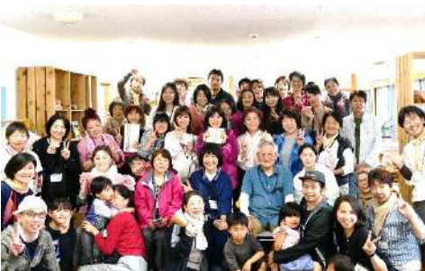
15:30 みんなで記念撮影