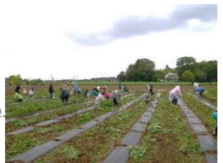
みんなで作業を分担し段取り良く進めていきました。チームワーク抜群でした！

今日はありがとうございました。短い時間でしたが、空気間、目と鼻の感覚、魂も体も活きた感じが、体の細胞にもっと感謝し、意識した方がいいかなと思います。