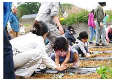
まるでみんなが家族のようでした。