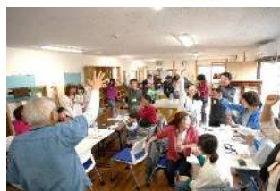
13:30 楽しいゲームの始まり！