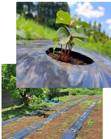
新しい芽がどんどん 出てきています！

今年も大変充実した種まき祭を行うことができました。皆さんの作業されている姿や、家族の杵をこえ子供たちや仲間たちをいたわりあう姿をみて人としての優しさや尊さを沢山感じさせて戴きました。来られた方はいろいろな意識をもっておられ、お互い良い刺激となり新たな意識の開拓となったのではないのでしょうか。 植えた種は芽を出し、天に向かってすくすく成長しています。見るたびに可愛さと生命力の凄さに感動を覚え、生きていくのではなく生かされているのだと実感します。梅雨の季節は不快を感じる時期でもありますが、大自然の営みは色鮮やかに織りなす美しい景色を見せてくれて実りの季節に進んでいることを実感させてくれます。世界中の人々が平和に暮らしお互いに尊重し助け合うこと、ふらのわの活動の根源でもあり理想でもあります『良い世界になる』ことではなく、良い世界に『する』ことを意識し心の雨天も晴天に変えてしまいうくらいの前向きさで自分自身を高めていきたいですね。皆さんの成長と心の平和を願って健康やかに過ごせますようお祈り申し上げます。