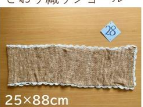
28 アフガン編み ショールマフラー