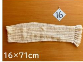
16 ワンタッチ簡単 着脱マフラー