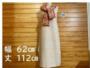
78 毎日楽しむ ストール付きワンピース