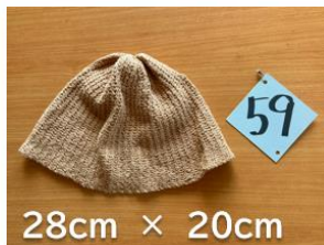
59 茶綿 ストレッチ編み帽子