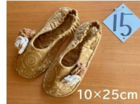
15 足取り軽やか ルームシューズ