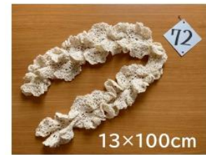
72 布良であったか 首元華やか