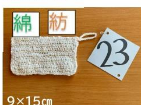
23 最高の食器洗い布