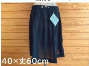
20 刺しゅう入りスカート