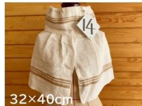
14 ネックショルダー ウォーマー