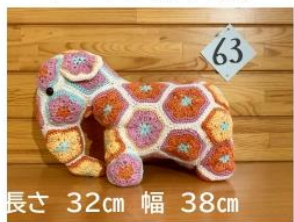
63 ハーモニー♪ (調和を願うゾウ)