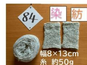
84 藍の生葉染め 手紡ぎリストウォーマー