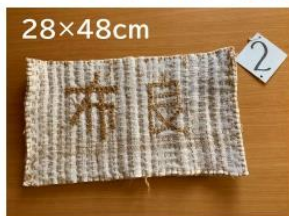
2 マリムーン入り リメイククロス枕