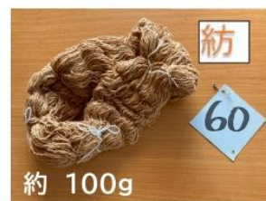
60 茶綿手紡ぎ糸 約 100g