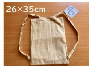
8 手作りリメイク マリムーンショルダー