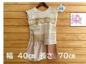
64 透かし編みベスト