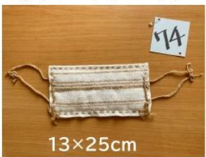
74 緑綿の綿と種の 手作りアイマスク