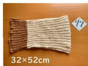
77 腹巻帽子 (帽子、スヌード、腹巻に)