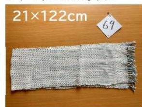
69 おだやかマフラー