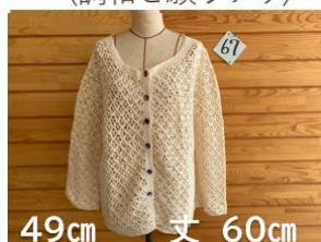
67 カーディガンジャケット