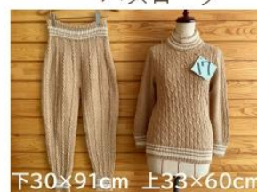
17 手編みのパジャマ