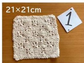
1 ハンカチのような小物