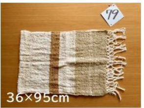
79 癒しのタペストリー