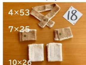
18 手首・足首・首ウォーマー