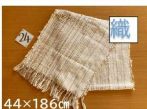
24 ふらの糸を使った さおり織りショール