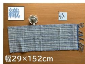
81 春～夏用の 手織りミニストール