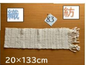
83 手紡ぎ糸のマフラー