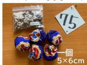
75 綿の種入り 子ども用お手玉