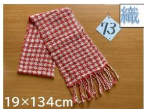
73 綾千鳥赤ストール