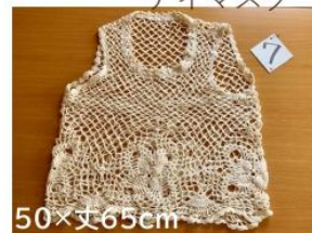
7 春先おしゃれベスト