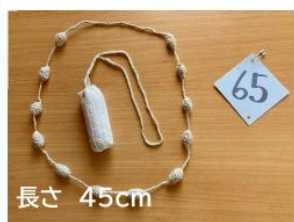
65 胸腺で免疫が高くなる デドックスのお手伝い