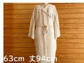
13 クロスのリメイク バスローブ