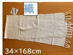
11 手織りの生成マフラー