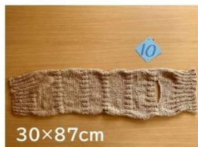
10 茶綿のわっかマフラー