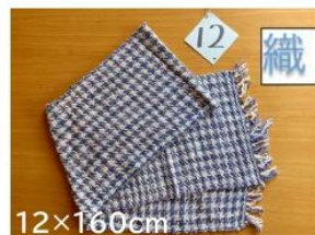
12 綾千鳥の 手織リストール