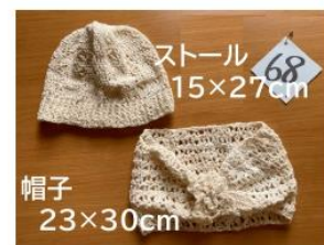
68 春のお出かけのおとも