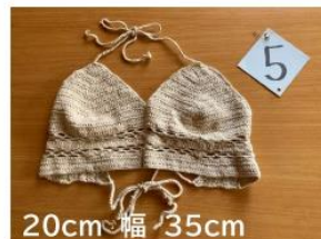
5 チョットと魅せたい 気もするブラジャー