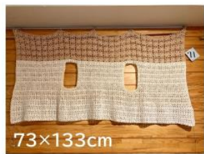
71 上下逆さまにも、 マフラーにもなるベスト