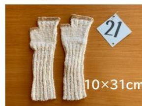
21 リストウォーマー