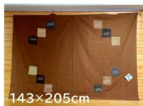
9 布良刺しゅう入り ベッドカバー