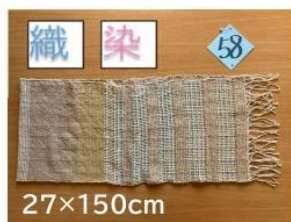
58 アボカド・栗・ヨモギ 草木染め手織りマフラー