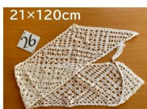
26 ボビンレースの マフラー