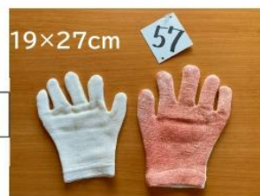
57 ドライヤーグローブ