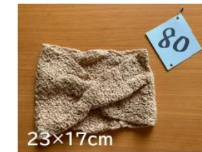
80 ネックウォーマー