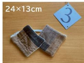
3 手作りマリムーン アイマスク