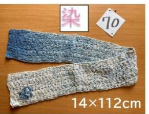
70 藍染め グラデーションマフラー