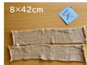
4 ロングアームウォーマー