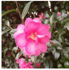
千葉 八街の研修所 近くでは 椿の花が美しく 咲いていました。 寒さに負けない、 美しさですね。