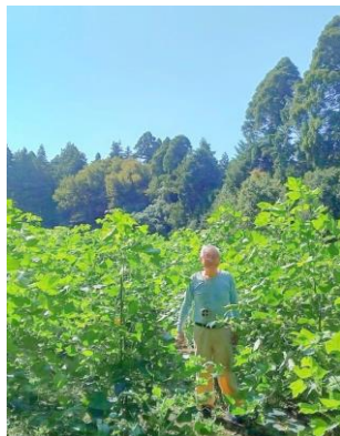
千葉 根古谷の畑にて。 育った綿の木と背比べ。 こんなに 大きくなりました！

また、敬老の日には、日本国内の100歳以上人口が発表されました。その人数はなんと、9万人。52年連続で増加しているとのこと！人生、まだまだ道半ば。私は70歳なので、100歳まではあと30年。30年先の未来へどう羽ばたいていくか。そんなことを感じた秋でした。皆さんは、どうですか？