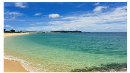
青い空、青い海。私が船乗り時代から親しみ続けた大自然の姿です。