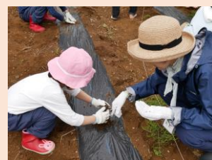
5/7種まきの様子。皆様のご協力での種まきが無事終わりました。ありがとうございました！