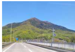
新緑の山の、鮮やかな色合い。

芽吹きの春。立夏の候、青葉茂る絶好の季節です。閉じていた新芽が一斉に吹き出した、その波動は胸を開き、心躍る気持ちにさせてくれます。遠く山や野原が柔らかな緑に染まると、柔らかな色合いは特別輝いていて、はつとせいられます。これは、自分の心がその光を感ずるからでしょう。何物にも代えがたい、素晴らしい自然のエネルギーです。 新緑のこの季節、自然の中に親しむきっかけを是非増やしてください。山、近くの公園や畑のまわりを散歩するだけでも違います。心を開ける、ストレス解消にもなります。のびのび、いきいきと茂る若葉から、エネルギーがチャージしましょう。 5月。いろいろなイベントも、自然の時期です。機会に合ったイベントも、自然の時期です。未来にならばいいなと思っただけでも、自然の時期です。