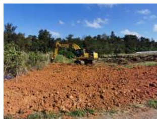
広大な畑。機材を借りて耕すことができました。