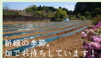
新緑の季節。 畑でお待ちしています!

昨年までは成田のふらのわファームでイベントを行ってききましたが、 今年から千葉県八街市に新しくオープンした ふらのわ研修センターで行うことになりました。 今年は新しい畑にて、種まきイベントを実施。 自然につつまれ、アーシング。大地を肌で感じましょう!