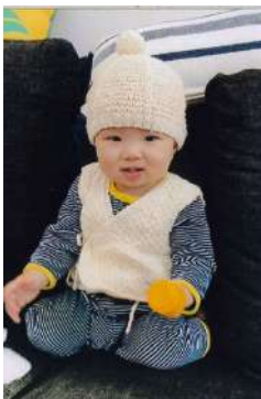
布良の糸の帽子、ベスト、靴下を身に付けたお孫さん。いい笑顔！

親、子、孫と三代にかけて、布良にかこまれてコロナに負けず元気に幸せに毎日を送っています。感謝、感謝です。布良に出会えて良かった。ありがとうございます。