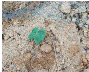
種まきをし、畑に根付いた綿の芽。

『綿の種を植えて、収穫した綿で糸つむぎをして、障がい者の方やお年寄りの生きがいに繋がるように』と、活動を開始されました。