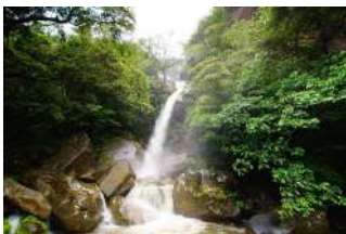
名護のパワースポット、轟の滝。この上に畑があります。