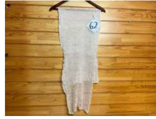
62 細糸手編みマフラー