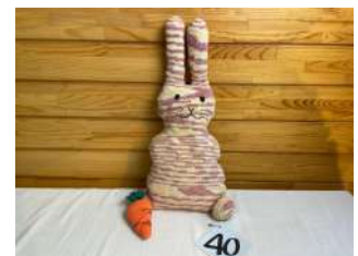
40 究極の癒しうさぎ