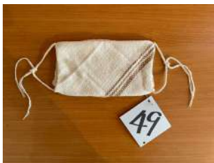
49 クロス付き手編みマスク