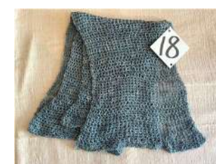
18 男性和服用のマフラー