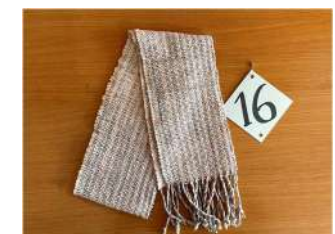
16 グレーのマフラー