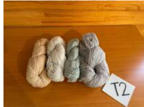
手紡ぎ糸 草木染め