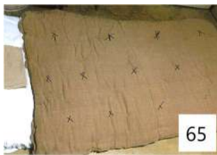
65 茶綿の手作り布団