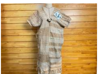
56 縄文への回帰『着衣』