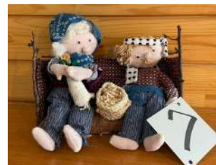
7 ひなたぼっこしている おじいちゃんおばあちゃん