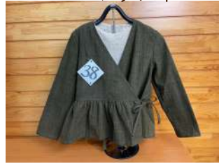
38 カジュアルブラウスと ストレッチ編みセット