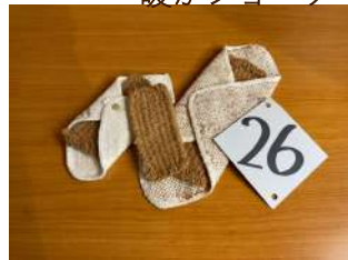
26 誰でも喜ぶパッド