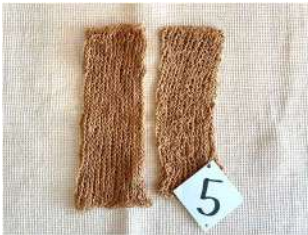
5 レッグウォーマー