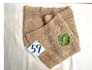
59 緑モチーフのマフラー