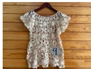
9 モチーフ編みベスト