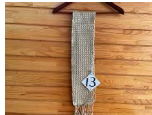
13 草木染めワッフル織り マフラー