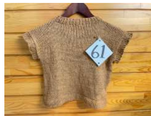
61 茶綿の肌着ベスト