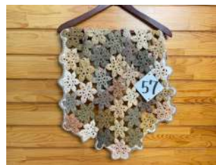
57 草木染のひざ掛け