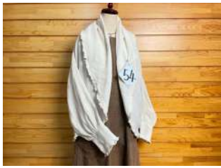
54 クシュクシュかわいいピコット襟のポレロ