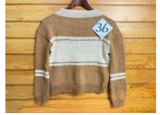
36 メリヤス編みのセーター