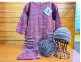
55 マリムーンとお出かけセット (チュニックと帽子)