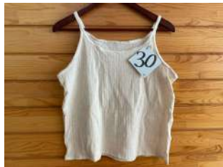
30 ニット生地の キャミソール