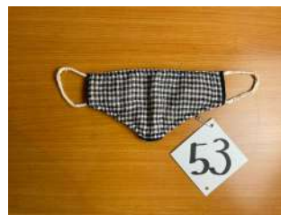
53 ふらのクロスマスク