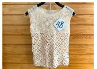
48 初めて作ったベスト