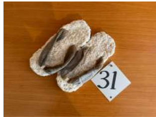
31 寄り添う ラーとルーの室内履き