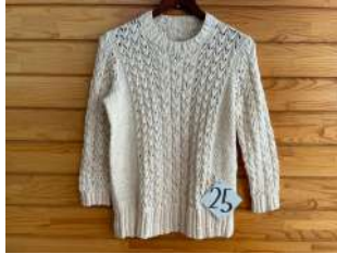
25 生成中糸セーター