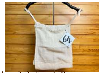
64 ふらちゃん3way (タオル・マフラー・ふんどし)