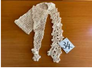
34 小花の ロングストール