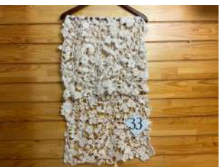
33 ポタニカルガーデン ショール