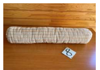
8 茶綿刺し子の 抱きまくら