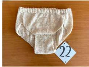
22 布良の糸の 暖かショーツ