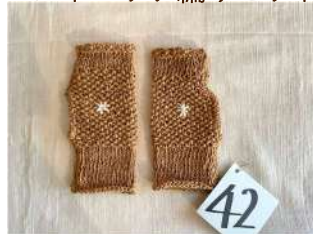
42 ハンドウォーマー