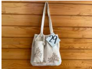
29 バッグとスマホケース