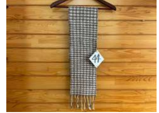
44 千鳥の手織りマフラー