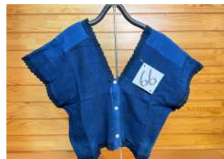
66 マリムーン活用ベスト