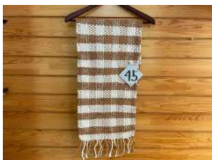
45 ななこ織りストール