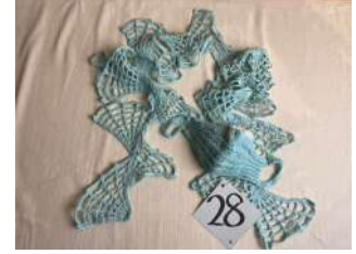
28 ポタニカルモチーフの マフラーとマスク