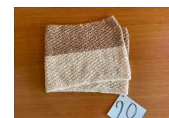
20 バイカラーヌード