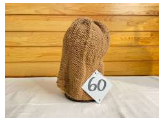
60 すっぽりかぶれる帽子