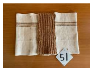
51 クロスとゴム編み腹巻き