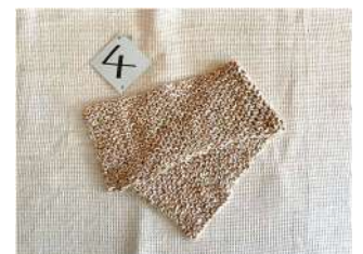
4 生成と茶綿のマフラー