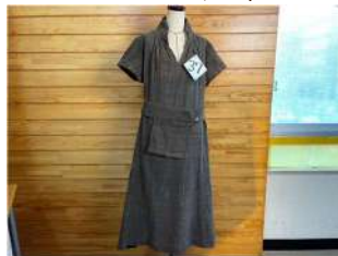
37 ウエストポーチ付き ロングワンピース