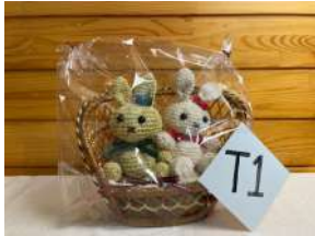
ラブ・ラブ ラビット