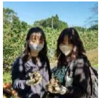
一宮の仲良し親子。皆さま、ご参加ありがとうございました。

10/25(日) 天候にも恵まれ、畑の収穫祭が無事に行われました。今年の天の恵みに感謝！