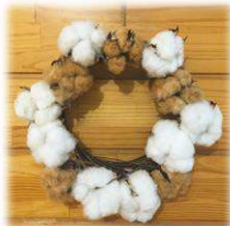
布良の畑で採れた、生成綿・茶綿を使用。

布良の綿を使ってリースを作るワークショップです。飾ってかわいい、見て癒される布良のリースを作ってみませんか？