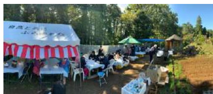
お天気も良く、畑で気持ちの良い時間を過ごしていただきました。