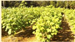
成田の綿畑。 夏の日差しを受け成長中。