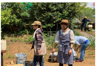
忙しく準備しています