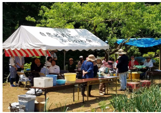
バーベキュー会場