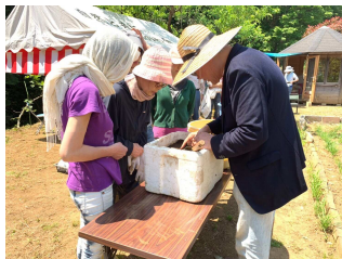
種まきのレクチャー中

ふらのわ会も 新たな種まきへ 五月十日 綿の種まきが無事完了しました 5月29日、苗の生育を観察しましたが、順調に発芽して、すくすく成長していました。ひとまず安心しました。 そしてこれからふらのわ会も令和の出発に向けて新しく種まきを行います。 より皆さんに喜んでいただけるべき、ふらのわ会を育てていくために会のしくみの変更する新たな種まきです。6月と7月を周知期間とさせて頂いた8月よりスタートしたいと考えております。どうぞ2か月間の間に出来るだけご出席して頂きたくお願いする次第です。 つどいでお会いしましょう。 前島