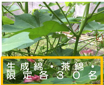
生 成 綿 ・ 茶 綿 ・ 名 限 定 各 3 0

暑い中、作業して頂くのでお礼として、 布良の金券を進呈させていただきます。 大地に感謝し、土に触れ、風邪を感じて みませんか？一緒に作業して下さる方、 大募集です。定員 毎回5名まで予約制