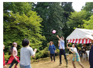
余興の風船バレーボール