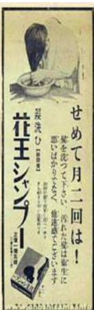
7-10、花王シャンプーの広告

布良は、優しく、温かく包んでくれ る最高の布です。感謝の気持ちを忘れ ず、使い続けたいと思います。