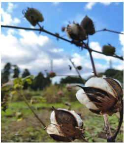
綿の収穫ができました。前日の雨が収穫祭の当日上がり気持ちもハレバレ

すが素晴らしいです。人の健康を助け 尚、かつ環境を汚さない生活をしていく仲間がこれからも増え続くと「最後まであきらめずやっていきます 仲間感謝。」 ■ 恒例の収穫祭が11月19日成田コットンファームで行いました。天気に恵まれ、気持ちいい畑に50人の会員が、お祝いに参加され 恵みと、天と地に一回で感謝しました。前半は沢山の完熟綿を摘んで楽しみ。種取りし、おいしく焼き上げた野菜と海産物とお肉をいただきながら親睦会を楽しみました。後半は久しぶりに会う友人と再会したり、特別おいしい焼き芋