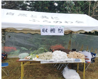
悪天候にめげずに成長 テーブルの上には茶綿、白綿、緑綿、ネギ、冬瓜、カボチャ、大根、白菜、が並びました。

いよいよ本年も師走になります。あらためて今年一年を振り返ってみると、「なんて素晴らしい」一年だったのだから」と思います。まず、前年度から20%も発展しました。それは、アース会員の成長でつどいが活発に開かれました。長年の例でいうとつどいの回数と実績が比例していますね。それから季刊誌の申し込みが増えたためと言えます。季刊誌を読むことでふらの価値を深く理解し上手に使うようになったと思います。ふらことの意気込みとスタッフの著しい成長が手前みそで