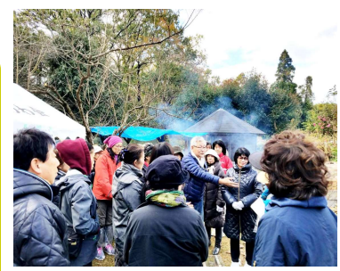
お陰様で、楽しくできました。和やかにスタート、広場いっぱい駆けつけて頂きました。