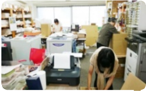
発送作業中のスタッフ 本社事務所

実は、布良のことが一番よくわかるのは赤ちゃんなんです。動物でいうと、猫とか犬です。彼等はすぐにやってきます。いちばん寄ってこないのは大人ですね。