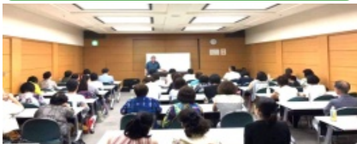
8月の大分市つどい 多くの参加に感激した。