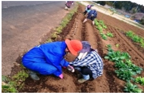
写真は3月末日 綿畑の隣にジャガイモの種まきしました。楽しみジャガ

● トイレの手入れ方法 臭いがしてくる季節になります、 そこで京都の坂元会員からトイレ や水回りには酢と水、半々をスプレ イ容器で振りかけると臭いや汚れが 付きにくくついても簡単にピカピカ にしてくれます。試しに自宅で実験 しましたところピカピカになりました。 ぜひ使い古した布良と一緒に お試しください。