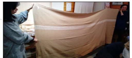
茶綿ブランケット