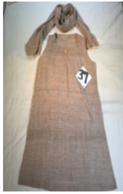
デザイン賞 坂上久子 新潟県新潟市 品名 柿渋染ワンピース