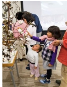
子供さんも参加 綿の木の綿に何故か 引き付けられてる