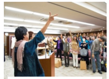
恒例のジャンケン