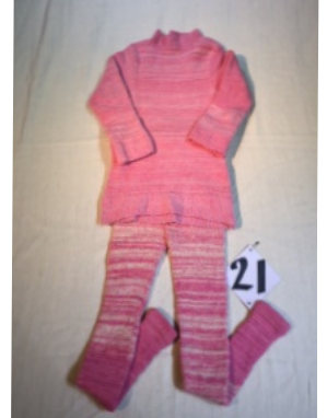
技術賞 安西裕子 北海道札幌市 作品名 セイタ スパッツ