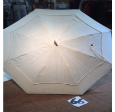
努力賞 越智美恵 京都市東山区 作品名 優しい布良ノ日傘