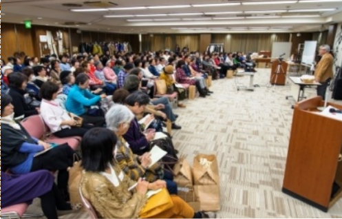
超満員の会場で コンテストや紙芝居・糸紡ぎなどを披露できました。

また、福袋の感激度がマックス であったのではなからうかと思 います。普段は買えない特価の糸