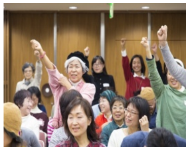
恒例のジャンケン(2)