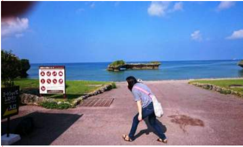
沖縄読谷村の海岸 キラキラな水と太陽 っどいで訪問した時、案内してもらった ラッキーなひと時 また行ってみたい。

2016年09月発行 号外306号 発行 / ふらのわ会 東京都中央区八丁堀 1-11-5 奥山ビル3階 電話 03-5540-851 FAX 03-5540-8601 ● オープン日 東京 サロン 火～土 10:00～18:00 ふらっとプラス札幌 火～土 10:00～18:00 (営業日が祝日の場合はお休みいたします) メール hula@cure.ocn.ne.jp