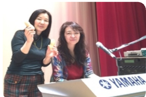
泣かせる歌NO1 心にスイッチオン コクーンさんと布良のご縁は10年も前で 8年前も参加していただいています

ご参加まだまだ受け付けております。2/20鉄鋼会館でお会いしましょう！二七年「新年会」申込み「日時」 2月20日(土) 13:30～16:30 「会費」前払い/6,000円 当日/6,500円