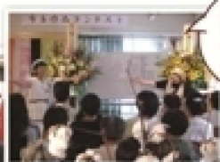
創刊当時は、東京サロンで作品コンテストを行っていました。