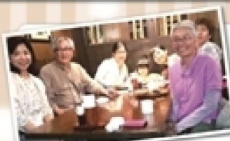
▲沖繩ふらのわ 仲食し食事会

従来開催していたイベントに加えて、新しいイベントの開催も企画しています。例えば、糸を紡ぎながらお酒を飲んだり、ワークショップの開催など、会員の皆さんと一緒に楽しめる企画を考えていますので、ぜひ創刊号をお楽しみに。