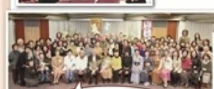
創刊10周年の時の新年会では、参加者全員で記念撮影！