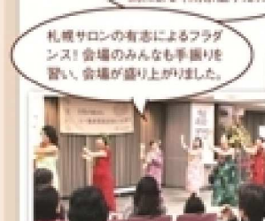
札幌サロンの有志によるフラダンス！会場のみんも手拍子を響け、会場が盛り上がりました。