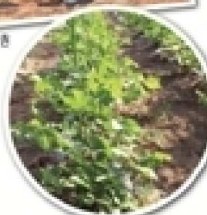
▲3か月後には大きく育ってる