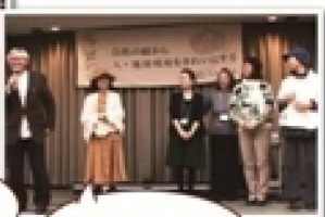
新年会ではスタッフ紹介も、どうぞよろしくお話しします。