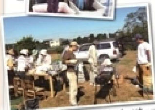
▲ふらコットンファームでのバーベキュー