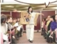
作品展のファッションショー。モデルも会員のみなさんです。