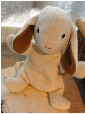
ぐるやして いさずり ぬいぐるみ 可愛いです 愛用者です で使えます ふらで可愛 みができます く思わず くわすま しませ

営業日 東京サロン 火～土 10:00～18:00 ふらっとプラス札幌 火～土 10:00～18:00 ふらっとプラス京都 水～土 11:00～18:00 (営業日が祝日の場合はお休みいたします)